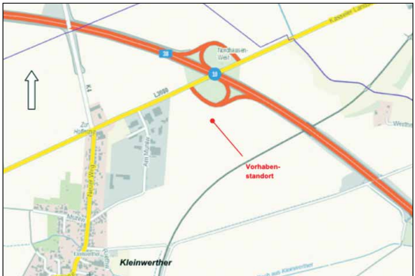
Kartenhintergrund: Geobasisdaten TLBG (Stand: 04/2021), Eintragungen: ThLG 2021 (Abbildung ohne Maßstab)

Übersichts-/Lageplan zum räumlichen Geltungsbereich des Vorhabenbezogenen Bebauungsplans (VBP), Gemeinde Werther, Gemarkung Kleinwerther, Flur 2, Flurstücke 69/10 und 69/18