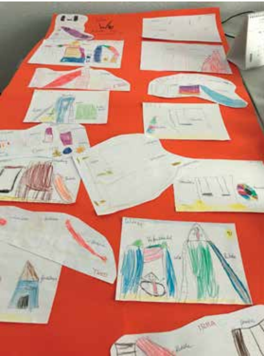
„Was sich unsere Kinder wünschen...“