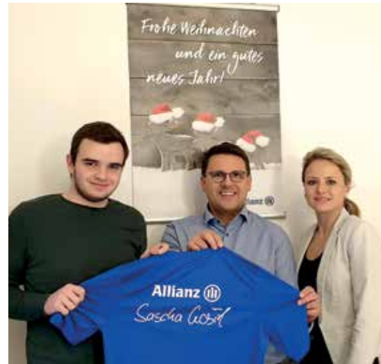
Neuanschaffung der Pullover bedanken. gez. F. Peter VfB Werther e. V.

Die Spieler, der Trainer und der Vorstand des VfB Werther, möchten sich recht herzlich bei der Spedition Otto für die