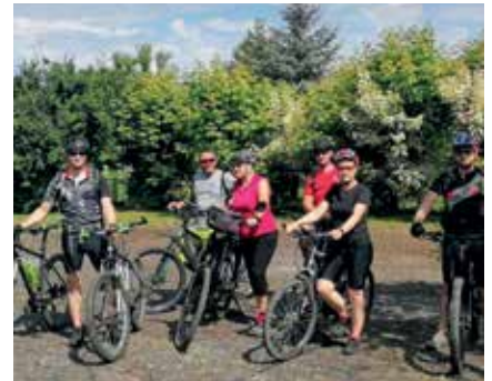
Haferunger Pedalritter auf Abschlusstour

Ziel des Stadtradeln ist es privat und beruflich möglichst viele Kilometer mit dem Fahrrad zurücklegen für mehr Radförderung, mehr Klimaschutz und mehr Lebensqualität in den Kommunen – und letztlich Spaß beim Fahrradfahren haben! gez. Teamcaptain