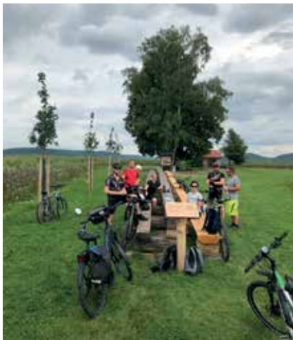
Längste Bank Thüringens

6113 Kilometer hat das Team „Haferunger Pedalritter“ beim Stadtradeln in 21 Tagen erradelt. Damit belegten wir im Landkreis Nordhausen einen sehr guten 4. Platz.