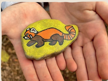
Tierischer Spaß beim Steine bemalen

Es war ein aufregendes Jahr. Gemeinsam mit unseren Klienten haben wir im Oktober das 10-jährige Firmenjubiläum von Miacosa gefeiert. Darauf sind wir natürlich besonders stolz und versprechen, auch in Zukunft mit vollem Einsatz für